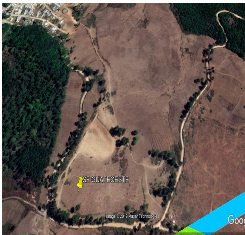
ILUSTRACION No.1 Ubicación Subestación GuateOeste